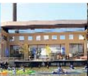
VALDIVIA CAMPUS VALDIVIA