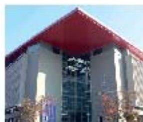
SANTIAGO CAMPUS BELLAVISTA

(NUEVA) Carrera Nueva - Admisión 2013 • Apertura Carrera en Sede