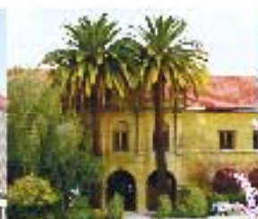
SANTIAGO CAMPUS LOS LEONES DE PROVIDENCIA