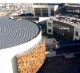
PUERTO MONTT CAMPUS PICH PELLUCO