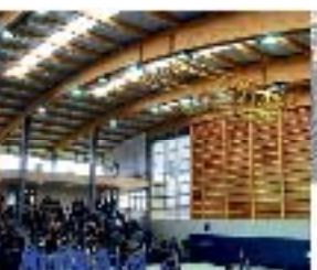
OSORNO CAMPUS PLAUCO