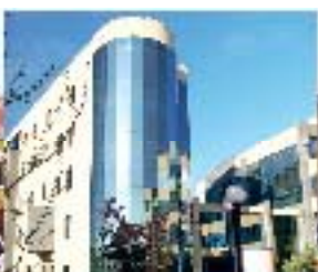
CONCEPCIÓN CAMPUS LAS TRES PASAJERAS